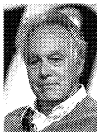
Francesco Giavazzi, docente di Economia politica all'Università Bocconi di Milano e columnist del Corriere della Sera .

«Le ragazze del Sud sono tra i migliori studenti della Bocconi». Dopo il sorpasso agli esami di maturità - un pienone di cento e lode - ecco un altro punto a favore del Mezzogiorno. L'elogio delle liceali di Siracusa è arrivato da Francesco Giavazzi, docente di Economia politica alla Bocconi e columnist del Corriere della Sera , durante un dibattito a Cortina il 20 agosto scorso, e proprio davanti al ministro all'Istruzione Mariastella Gelmini. Un complimento in linea con i risultati degli ultimi esami di maturità in Italia. La mappa dell'Italia da 100 e lode mette in evidenza, infatti, un Sud di eccellenze. Sono 4.037 i diplomati cum laude negli istituti superiori del Paese, e tra questi quasi la metà - per l'esattezza 2.016 studenti - sono meridionali.